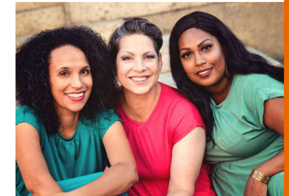
Soul Sisters – The Magic of Voice